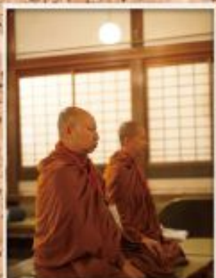
坐禅をする上座部僧侶