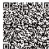
ホームページ記事