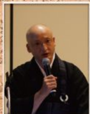
被災地の現状を語る僧侶