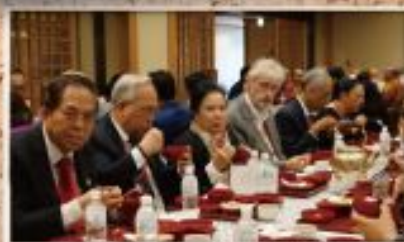
各国の世界大会出席者