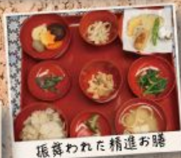
振舞われた精進お膳