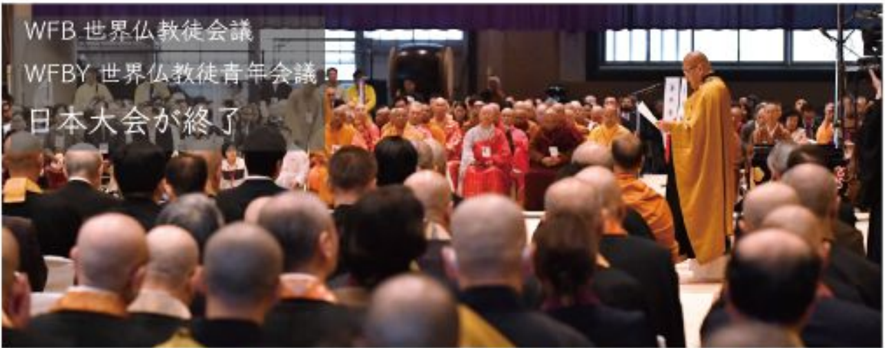
WFB 世界仏教徒会議 WFBY 世界仏教徒青年会議 日本大会が終了

全国の理事会で承認され、六月から副会長の大役をいただきます。任期は二年です。出張がこれまでに増えそうですが、これが終われば私の全国活動は終了です。力の限り務めさせていただきます。