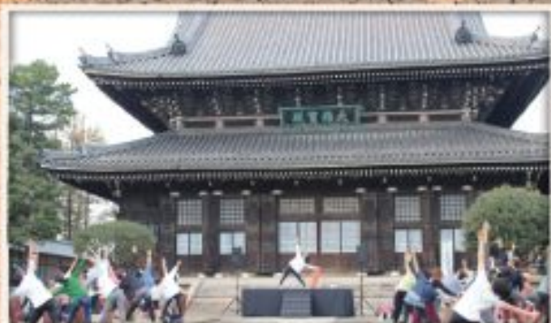
青空ヨガ 總持寺仏殿前