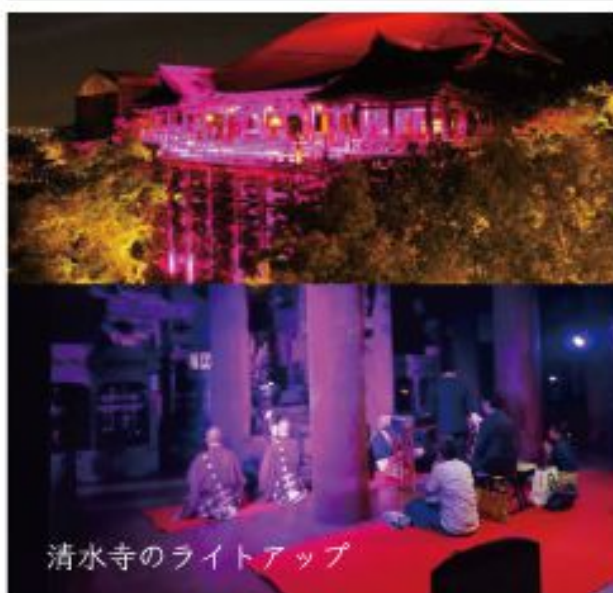
清水寺のライトアップ

発症し、子育て世代にとって家族の生活を一変させる病気の代表です。お檀家様にも、ご闘病中のご家族ご友人がごありの方も多くいらっしゃると思います。 乳がんは早期発見が治療の要であるといえます。縁あっていただいた命を尊び、受診を心がけるのはご家族の暮らしを守ることに繋がります。