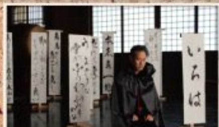
言霊のレストラン 仏殿内