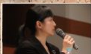
お寺の役割を議論する