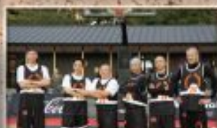
大本山でスポーツを