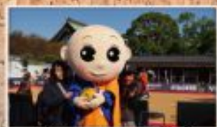
ゆるキャラも登場