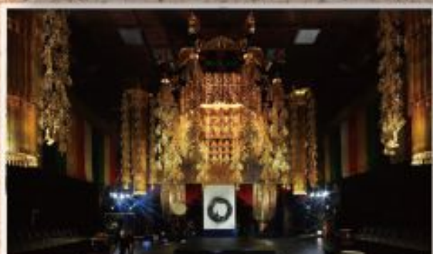
仏教音楽祭 会場：總持寺大祖堂